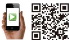
Vídeo de la autora

Ayudarnos a tomar conciencia del panorama profesional que estamos viviendo y el que está por llegar, medir nuestra capacidad para adaptarnos al cambio y empezar a adquirir la mentalidad knowmads son los objetivos que persigue la obra.